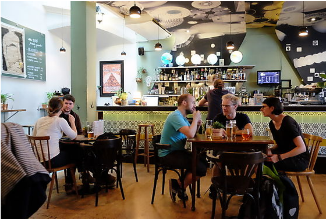
Moustache, Herzog-Otto-Straße 8

Diese Mischung ist wirklich etwas Besonderes. Man kann fast aus jeder Gasse in Innsbruck auf irgendeinen Berggipfel sehen. Gleichzeitig werden in immer schnellerem Takt gerade spannende neue Lokale eröffnet – vom hippen Kater Noster , über das charmante Moustache bis zum extrem lässigen John Montagu (die Sandwiches sind wirklich genial!). In Innsbruck tut sich gerade wirklich viel Neues. Ein Tag ist eigentlich echt zu wenig für all das, was die Stadt zu bieten hat. Ich muss wohl nicht dazusagen, dass ich mich in Innsbruck sehr wohl fühle. Trotzdem geht es morgen schon nach Bregenz. Die Challenge geht weiter!